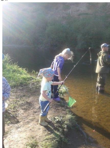
Презентация проекта «Наши семейные традиции»