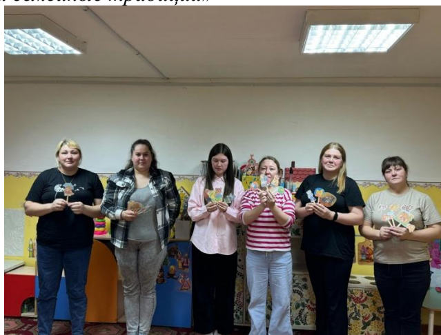
Мастер-класс для родителей «Верховой театр»