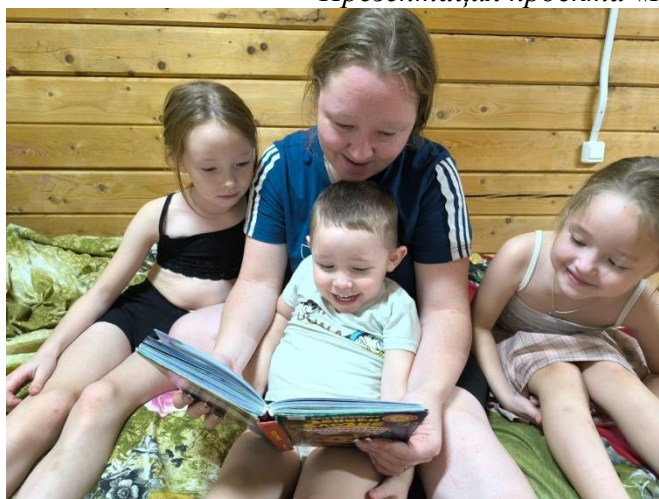
Акция по семейному чтению «Читающая мама – Читающая семья»