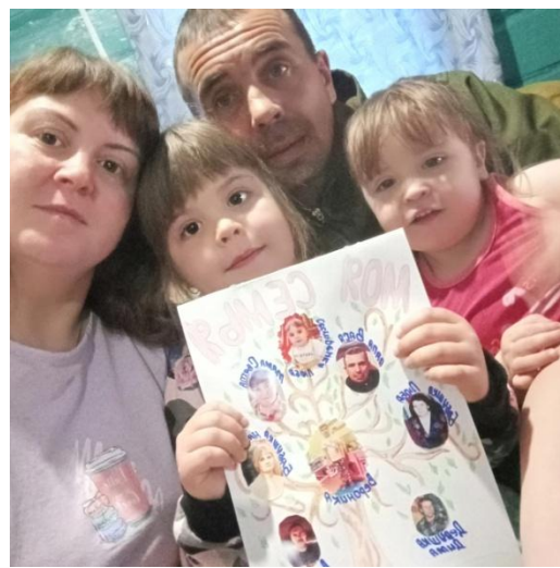
Проект «Семейное древо»