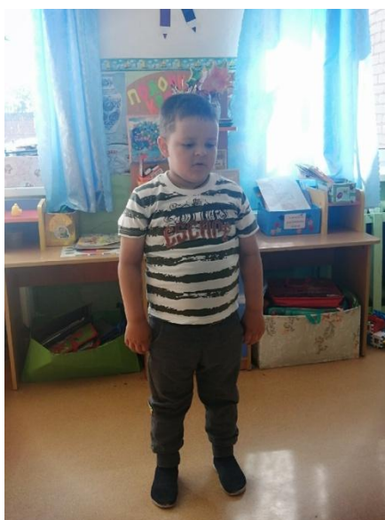
Фотогалерея «Это всё моя малая Родина!»