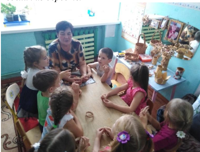
Изделия из бересты