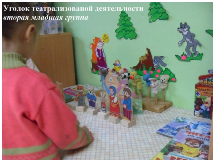
Уголок театрализованной деятельности вторая младшая группа