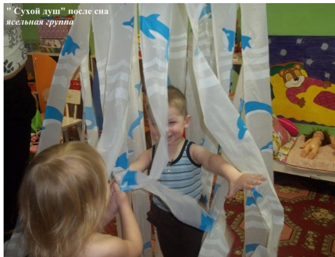
"Сухой душ" после сна ясельная группа