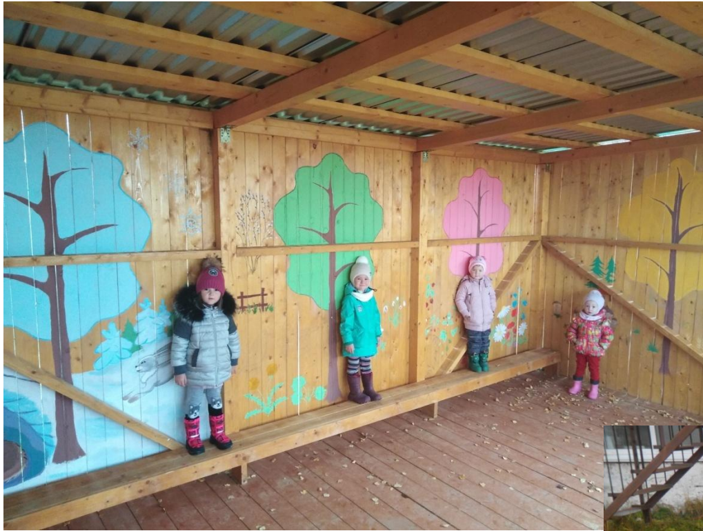
Площадка средней группы